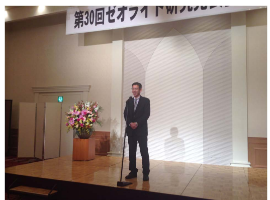
会長ご挨拶（懇親会）